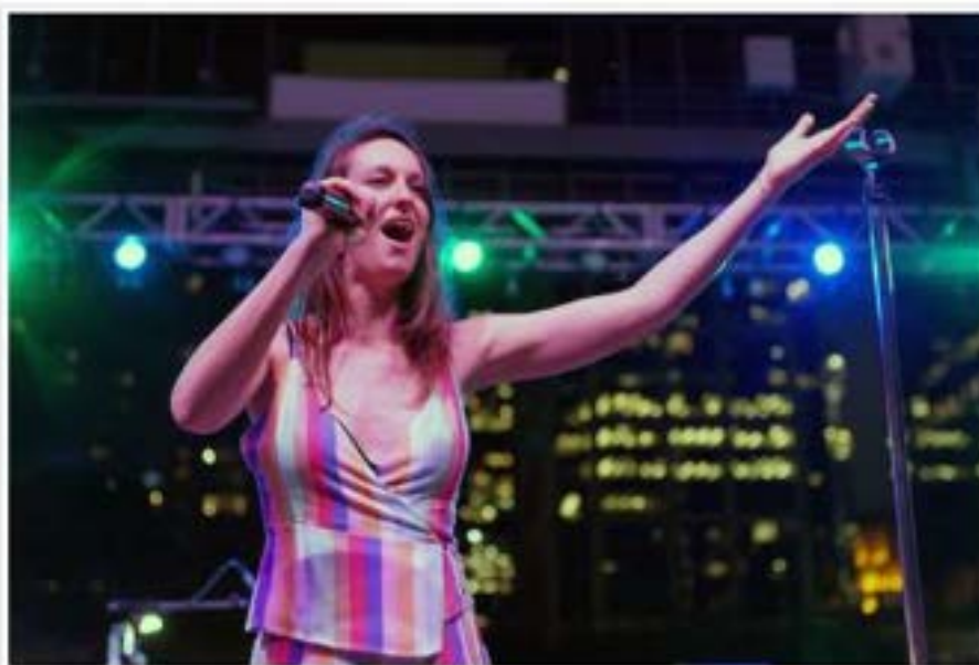
À Houston, Texas, dans le cadre du French Culture Festival.

LE 18 MARS 2019 / PAR FRANCOMUSIQUE / DANS ENTREVUES